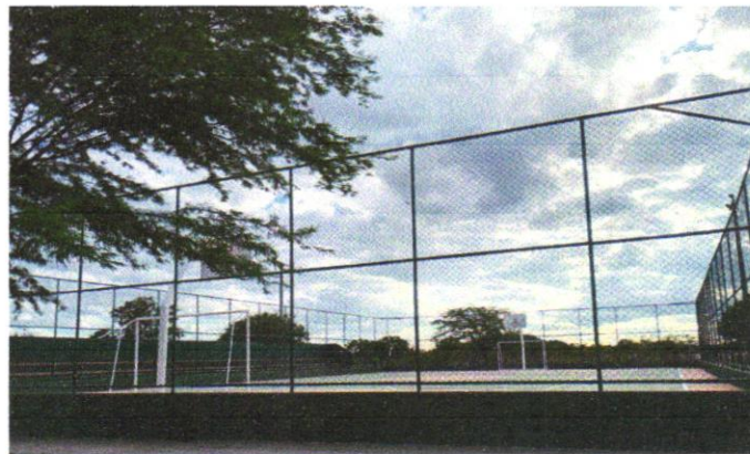
FOTO 01 - ALAMBRADO PARA QUADRA POLIESPORTIVA, ESTRUTURADO POR TUBOS DE AÇO GALVANIZADO, (MONTANTES COM DIÂMETRO 2", TRAVESSAS E ESCORAS COM DIÂMETRO 1 1/4"), COM TELA DE ARAME GALVANIZADO, FIO 10 BWG E MALHA