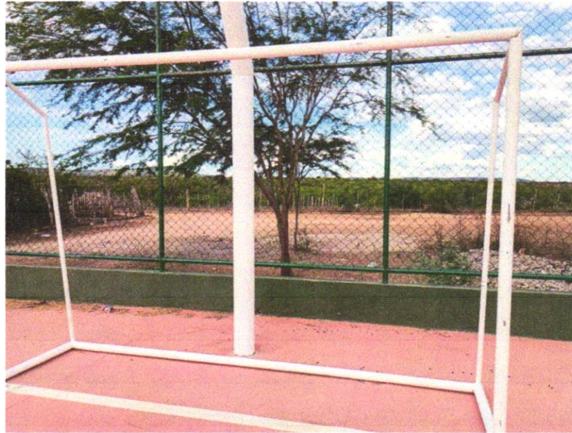
FOTO 03 - Traves oficial para futebol de salão 3x2m em aço galv.3", com requadro e redes de polietileno fio 4mm (conjunto p/futsal)